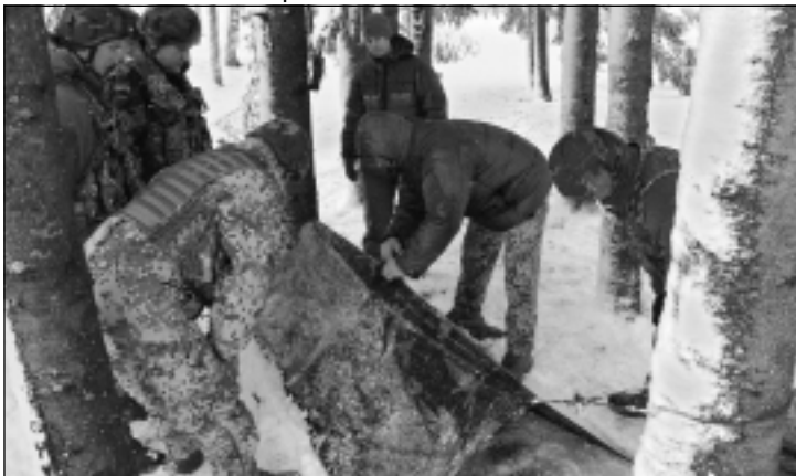
Darbs grupās. Individuālas nojumes uzcelšana zemessargiem bija jāveic kopīgi.