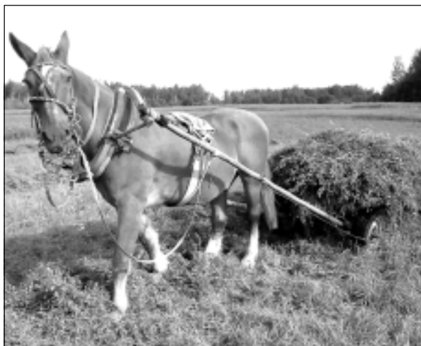
Vasaru atceroties. Iesūtīja Natālija Zēģele no Baltinavas.

Katra mēneša labākās fotogrāfijas autors saņems balvu. Fotogrāfijas var iesūtīt pa pastu - Balvi, Teātra ielā 8, LV-4501, vai elektroniski - vaduguns@apollo.lv. Pie foto obligāti norādāms vārds, uzvārds (vēlams - tālrunis).