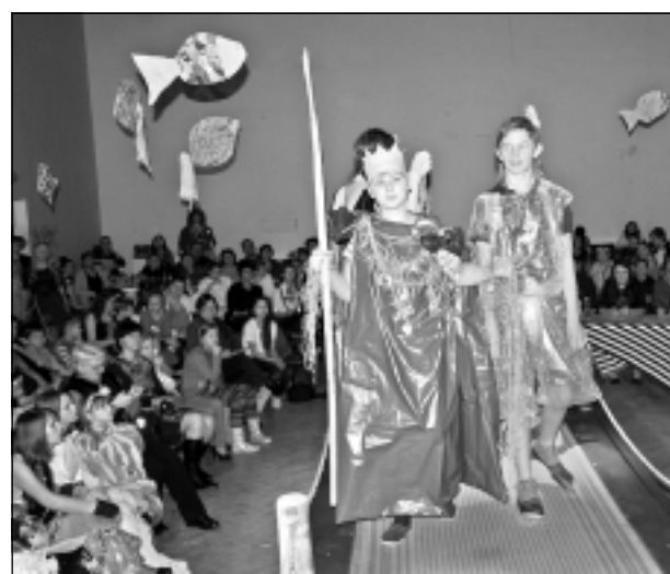
Neptūns nāk! Kur ūdens, tur Neptūns. Sveķu internātpamatskolas tērpu kolekcija “Es redzēju jūriņā” izpelnījās “Latviskākās tērpu kolekcijas” diplomu. Skatītājiem nebija šaubu, ka uz mēles atrodas pats Neptūns ar žebērkli rokās.