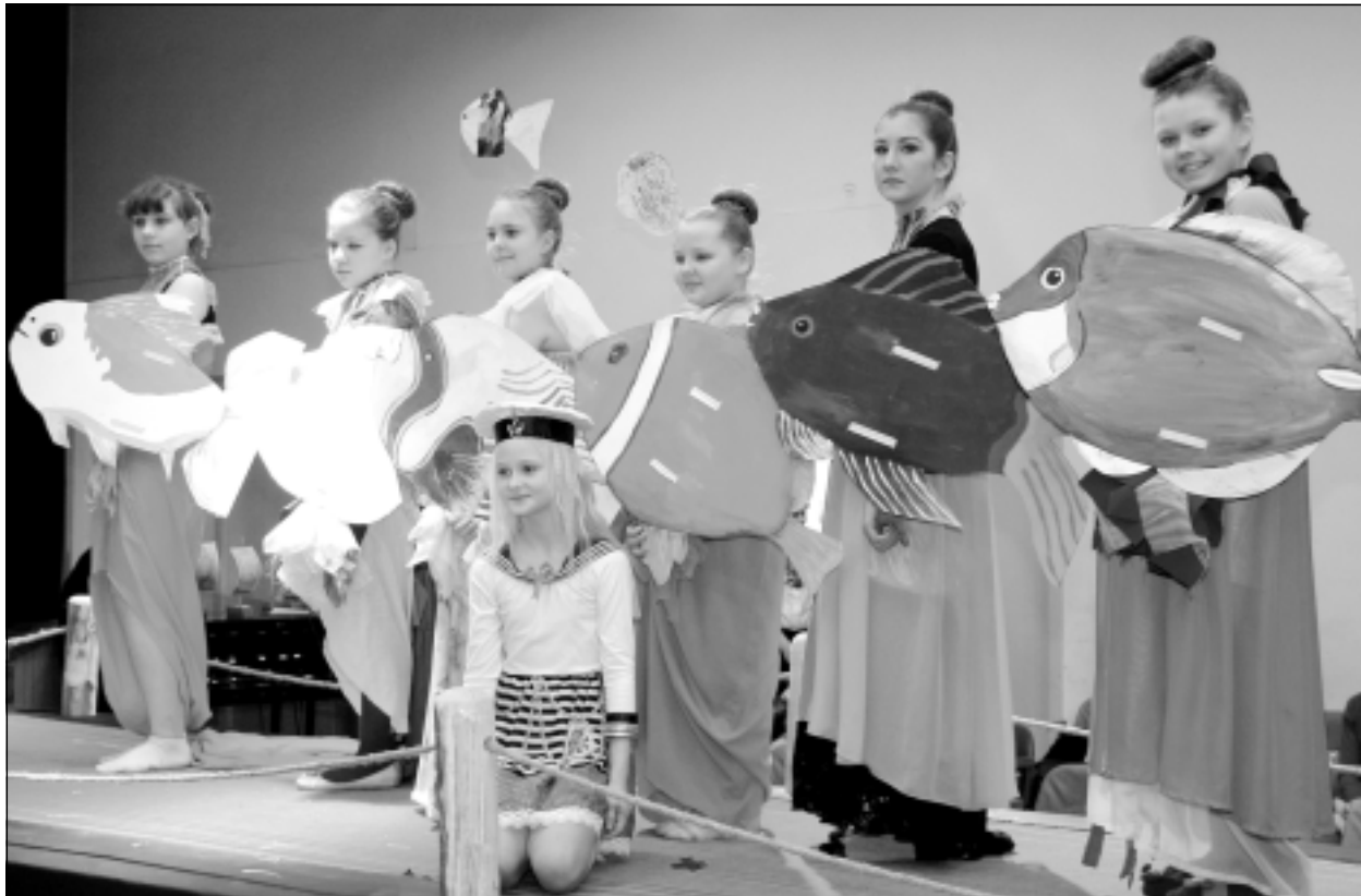
“Jūrnieka laimes zivtiņas”. Tērpu kolekciju “Jūrnieka laimes zivtiņas” skatē demonstrēja Baltinavas vidusskolas meitenes. Kas ir jūrnieka laimes zivtiņa, spriediet paši! Kolekcija izpelnījās diplomu “Gaumīgākā kolekcija”.