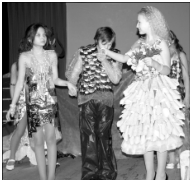
“Pasaka par nāriņu”. Aleksandrovas internātpamatskolas tērpu kolekcija “Pasaka par nāriņu” izpelnījās “Teatrālākās kolekcijas” diplomu. Sižeta pamatā, šķiet, bija stāsts par divām nāriņām, kuras izglāba jauniņi, bet ziedu pušķīti no viņa saņēma viena. Skumji, vai ne?!