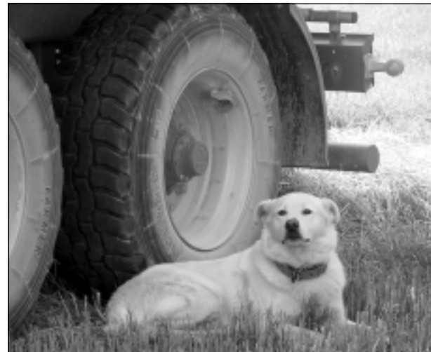
Nenāc klāt! Iesūtīja Elmārs Zelčs.