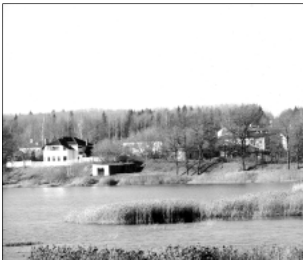
Balvu ezers.