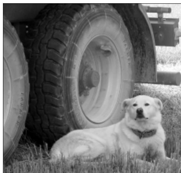
Sargs. Iesūtīja Elmārs Zelčs.