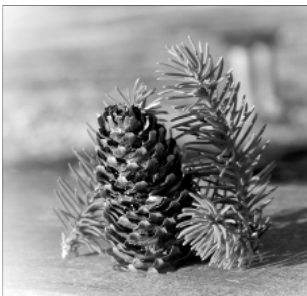
Bez vārdiem.

Katra mēneša labākās fotogrāfijas autors saņems balvu. Fotogrāfijas var iesūtīt pa pastu - Balvi, Teātra ielā 8, LV-4501, vai elektroniski - vaduguns@apollo.lv. Pie foto obligāti norādāms vārds, uzvārds (vēlams - tālrunis).