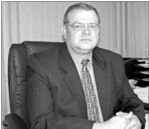
ZIGURDS BLAUS, Ropažu novada domes priekšsēdētājs