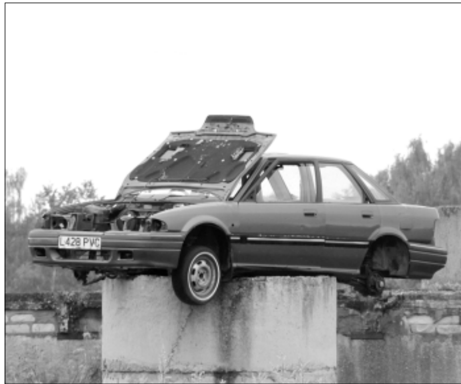
Gulbenes pusē. Ja spēkrats ir nolietojies un automašīnai tehniskās apskates veikšana vairs nav aktuāla, to var izmantot arī citiem mērķiem.

Iniciatīvas ar salīdzinoši lielu atbalstu bijušas arī iepriekš, bet tas nenozīmē, ka to autoram un viņa atbalstītāju pulkam ir garantēts veiksmes stāsts, proti, iniciatīvas iesniegšana parlamentā un Saeimas deputātu vairākuma balsojums par tās atbalstīšanu. Kā būs šoreiz, grūti spriest, bet CSDD, kas ir tiešā veidā saistīta ar transportlīdzekļu tehniskās apskates veikšanu, uz iespējamajām pārmaiņām raugās skeptiski.