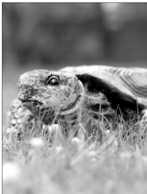
Kas tas? Iesūtīja Juris Kašs no Balviem.

Katra mēneša labākās fotogrāfijas autors saņems balvu. Fotogrāfijas var iesūtīt pa pastu – Balvi, Teātra ielā 8, LV-4501, vai elektroniski – vaduguns@apollo.lv. Pie foto obligāti norādāms vārds, uzvārds (vēlams - tālrunis).