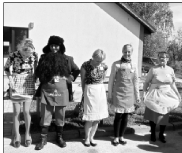
Lappusi sagatavoja I.Zinkovska