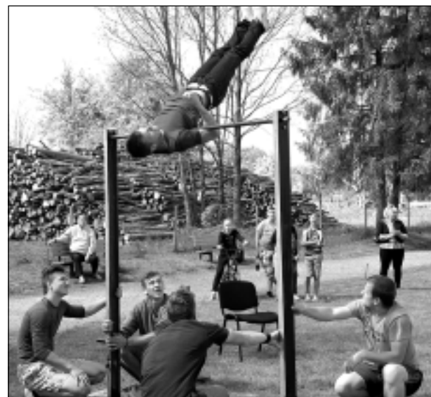
Rāda paraugdemonstrējumus. Vingrotāji no Briežuciema Bērzpīlī rādīja spēku, veiklību un izturību.