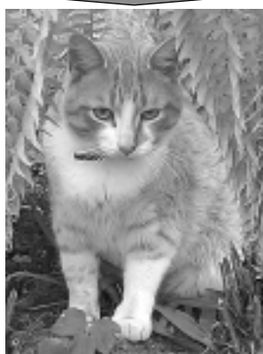
Pazudis ruds KAĶIS. Atlīdzība garantēta. Tālr. 26185335.