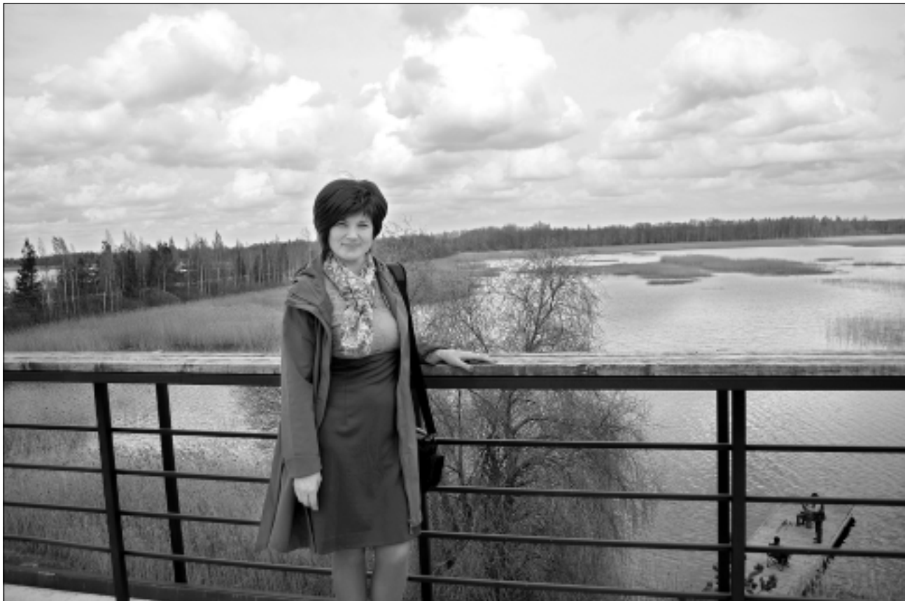
Dabā. Intai patīk baudīt svētku noskaņu. To rada arī dabasskati.