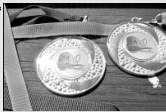
Medaļas ar Bērzpils pagasta logo.