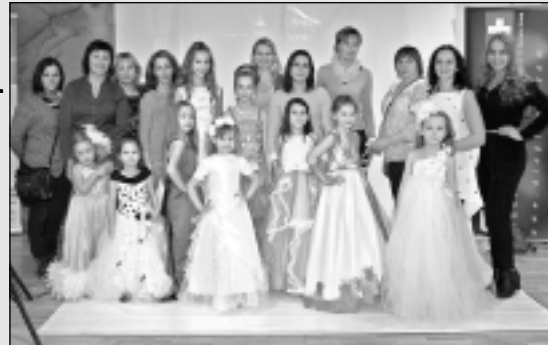
Panākumus gūst “Lotes” meitenes.