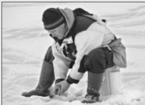
Triumfē Latvijas čempionātā.