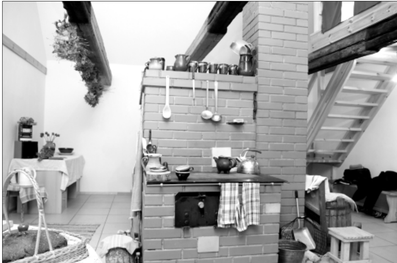
Mājas saviesīgais gals. Te kurina malkas plīti, lielajā krāsnī cep maizi un pie tējas krūzes klausās stāstus par rakstnieka dzīvi un darbiem.