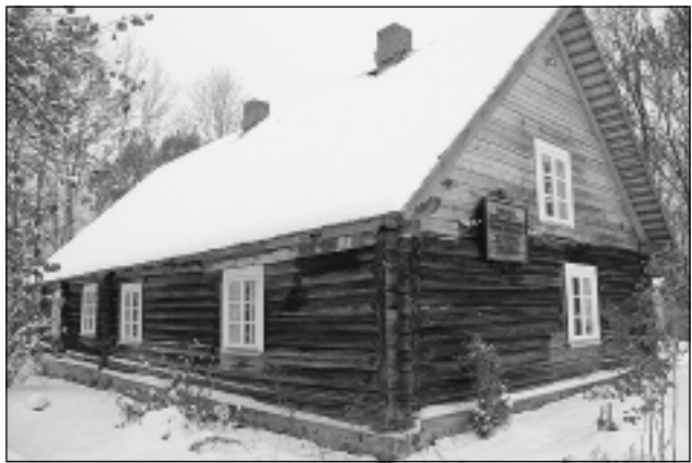
Kultūrvēsturiskā māja. Atjaunotā Apsīšu Jēkaba māja atkal dzīvo savu ikdienu. Turp nāk vietējie, brauc skolēni, notiek dažādas aktivitātes. Māja gan vēl gaida iekštelpu pilnīgāku iekārtošanu, taču istabiņās ir skatāma rakstniekam veltītā ekspozīcija.