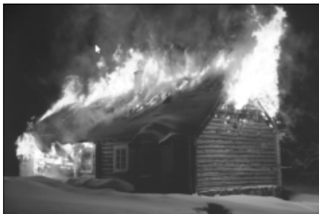
Vēsturisks foto. Ugunsgrēku nofotografēja kaimiņš, skriedams palīgā, lai glābtu vēl, kas glābjams. Tajā laikā mājas vienā galā dzīvoja kāds vīrietis ap gadiem piecdesmit, pēc būtības alkoholiķis. Kādā februāra naktī mājas viena puse uzliesmoja.