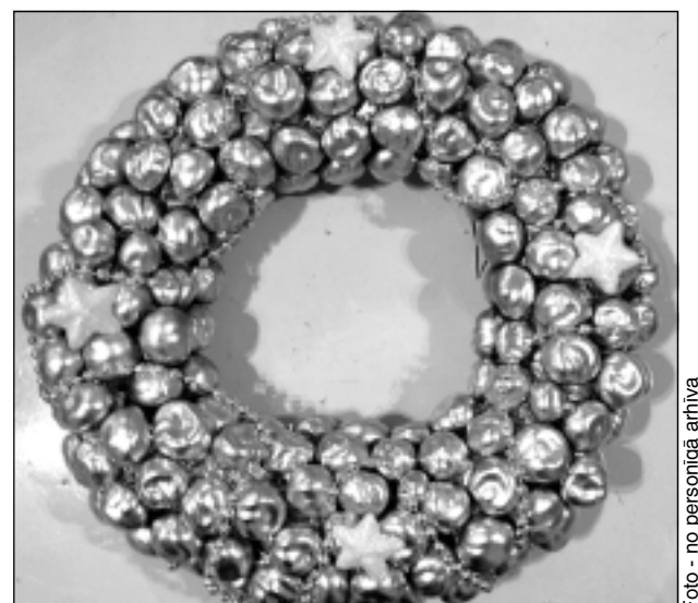
Kā nevienam. Pulciņa dalībnieces nereti realizē ļoti neparastas idejas, piemēram, Agnese Kaša pērn izveidoja Adventes vainagu no kastaņiem sudraba krāsā.