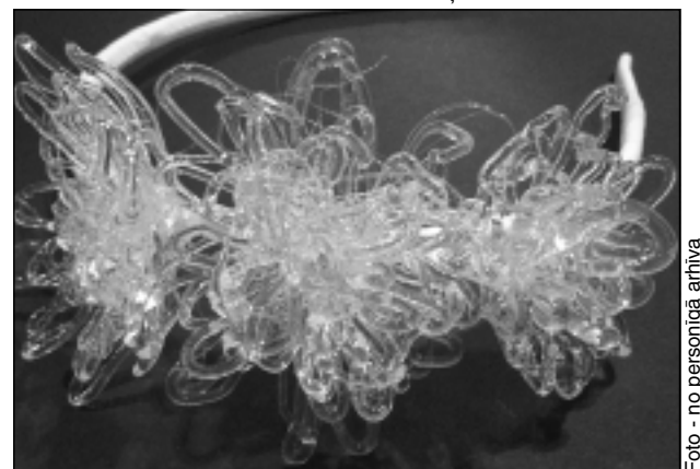
Ledus ziedi. Grūti noticēt, ka šādas galvas rotas iespējams izgatavot, izmantojot tikai sniegu un karsto limi.