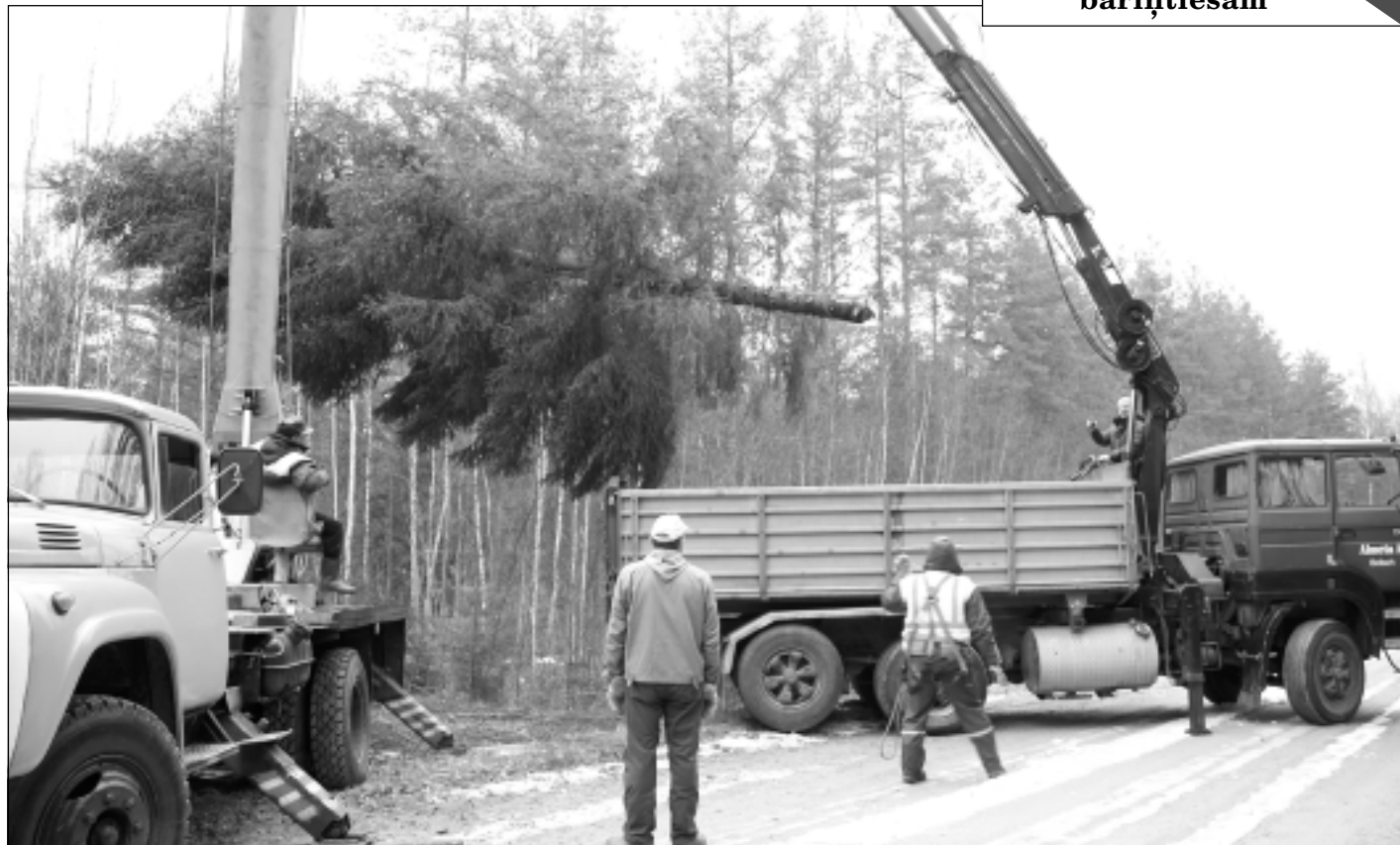
Skaistule no Balvu mežniecības Sitas mežiem. 12 metrus augsto zaķu skaistuli Balvu centrā uzstādīja jau otrdien.

Saeima šonedēļ galīgajā lasījumā pieņēma Ekonomikas ministrijas izstrādāto "Jaunuzņēmumu darbības atbalsta likumprojektu", kura mērķis ir veicināt strauji augošu tehnoloģiju uzņēmumu jeb jaunuzņēmumu veidošanos Latvijā, tādējādi sekmējot pētniecības attīstību un pētniecības produktu (inovatīvu ideju, produktu vai procesu) komercializāciju. Paredzēts, ka jaunuzņēmumiem būs pieejama atbalsta programma fiksētā maksājuma veikšanai ar papildu iespēju saņemt iedzīvotāju ienākuma nodokļa un uzņēmumu ienākuma nodokļa atvieglojumu; kā arī atbalsta programma augsti kvalificētu darba ņēmēju piesaistei ar papildu iespēju piemērot uzņēmumu ienākuma nodokļa atvieglojumu. Likums stāsies spēkā 1. janvārī.