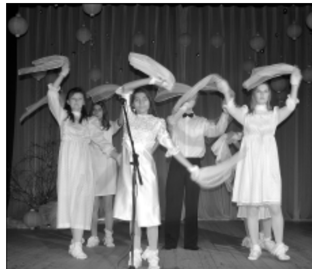
Sniegpārslis dejas. Baltinavas Kristīgās internātpamatskolas meitenes koncertā izpildīja sniegpārslis deju. Šalles un čibiņas viņas bija darinājušas pašas darbā - cības stundās.

Pasākuma organizatori cer, ka koncerta noslēgumā izskanējušais vēlējums: “Dieva miers lai ar jums!” katram dos Dieva gaismu, ticību, sirdsmieru ceļā uz Jēzus dzimšanas svētkiem.