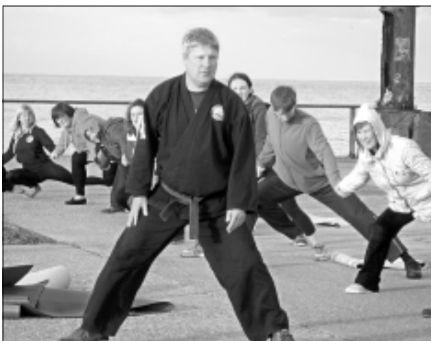
Vingrošana pie jūras. Vispirms lūgšana par sevi un citiem, noskaņošanās uz panākumiem, smaids, ticība un tikai tad darbs ar savu ķermeni.