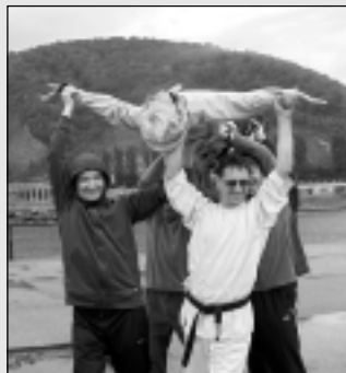
Par dāvanu, Žim Lam un Krieviju.