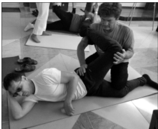
Palīdzī otram. Meistarklasē daudzi vingrojumi un darbības bija jāpilda divatā.