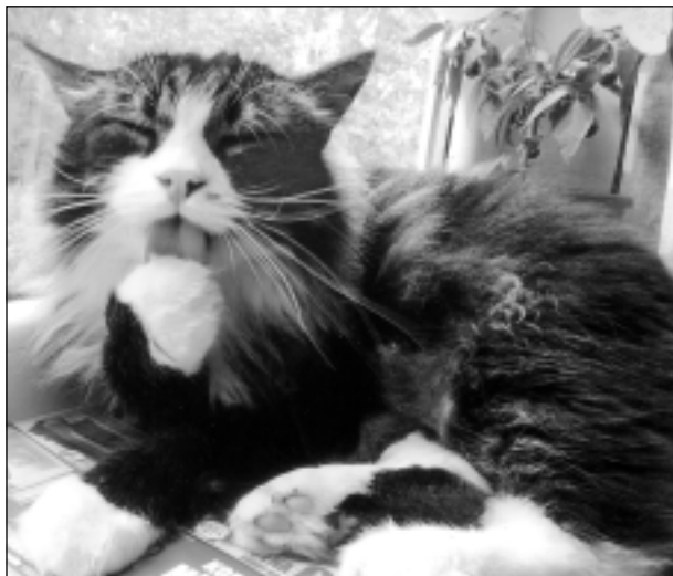
Pēc maltītes. Iesūtīja Daniels Kivkucāns no Balviem.

Katra mēneša labākās fotogrāfijas autors saņems balvu. Fotogrāfijas var iesūtīt pa pastu – Balvi, Teātra ielā 8, LV-4501, vai elektroniski – vaduguns@apollo.lv. Pie foto obligāti norādāms vārds, uzvārds (vēlams - tālrunis).