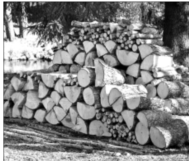
Lai silta, jauka istabiņa. Iesūtīja Rinalds Martiņenko. Lappusi sagatavoja E.Gabranovs