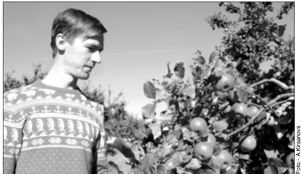
Zaros likst sārtie āboli. Šogad jaunajā augļu dārzā padevusies laba raža. Protams, ne bez saimnieku ieguldītājam pūlēm. Sārtie āboli tā vien prasās iekosties.

vērā, ka daba ar āboliem apveltījusi arī citus dārzus Latvijā, tad to cena šoruden būs mazāka nekā iepriekšējos gados. Tādēļ ābolus saimniecībā nolemts uzglabāt vēlākam laikam, jo tam ir atbilstoši apstākļi. Ābeles arī izvērtē. 'Antonovka', piemēram, ir pateicīga šķirne, lai no sēklām izaudzētu potcelmus.