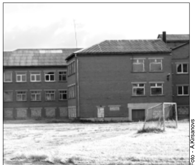
Bēdīgs skats. Slēgtajā Kupravas pamatskolas ēkā, kuras renovācijā pirms dažiem gadiem ieguldīta krietna nauda, šobrīd izmanto tikai sporta zāli. Lai skolas ēku neizdemo-lētu, tās 1. stāva logi aizsīsti ar dēļiem.