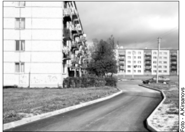
Šis vasaras veikums. Lielākais šovasar paveiktais darbs ir noasfaltētā Pagalma iela.