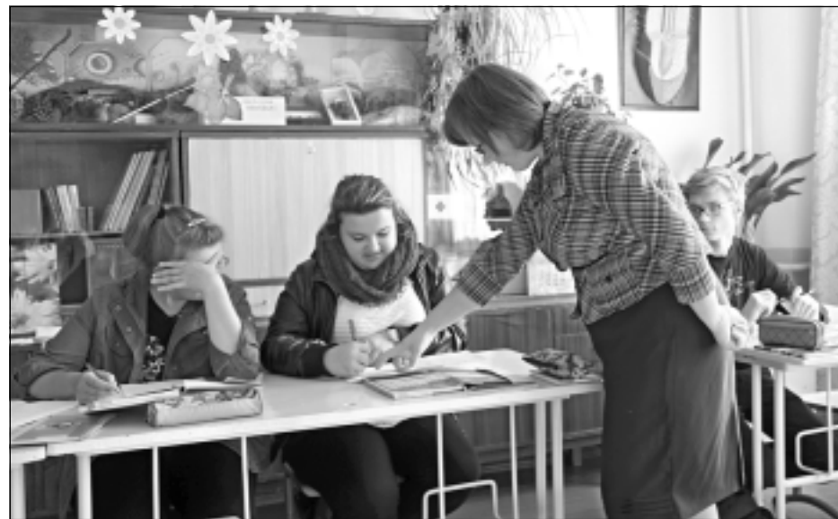
Mācību stunda apvienotajā klasē. Trešdienas rītā Briēžuciema pamatskolas apvienotajā 7., 8. un 9.klasē mācību vielu apguva trīs skolēni, kuriem šādā veidā organizētas mācības jau ir ikdiens.

klasē, kurā mācās visu pamatskolas klašu skolēni, un tas nebūt nav viegli. “Nereti lielo skolu pedagogi argumentēti saka: kas jums, nav tik daudz skolēnu, kam stāstīt mācību vielu. Taču būtībā man mācību stundas laikā jāpasaka tas pats, kas lielajā skolā, tikai tas jāizdara 8 minūtēs. Tieši tik daudz laika es varu veltīt katram skolēnam. Un tā mācību process notiek praktiski visiem skolotājiem visos priekšmetos,” skaidro A.Keišs.