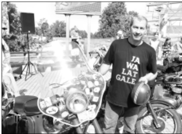
Pirmo Jawu saņēmis mantojumā. Motociklists no Lietuvas, kurš sevi pieteica kā moču mīli, "Jawas" salidojumos Latvijā piedalās jau ceturto gadu pēc kārtas. Viņš smēja, ka labāk tikties ar domubiedriem, nekā sestdienas vakaros sēdēt pie TV un dzert alīņu: "Jaunībā man nebija motocikla, kaut gan par to ļoti, ļoti sapņoju. Pirmo Jawiņu saņēmu mantojumā, bet tagad man mājās jau ir astoņi moči. Miļākā ir 1961.gada "Jawa", ar kuru šobrīd arī braucu."