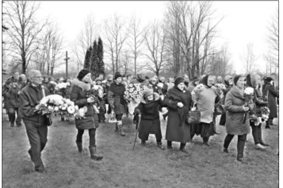
Ceļā uz kapu kopiņu. Izrādīt cieņu Albertam Budžem vēlējās ļoti daudz cilvēku – no prāvesta atvadījās novadu vadītāji, politiķi, kultūras darbinieki, pedagogi, mediķi, rakstnieki...