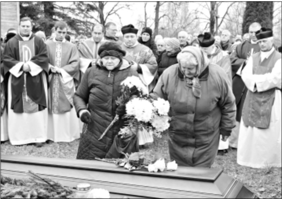
“Tā vēlējās prāvests!” Kad bērū dalībnieces uzlika ziedus uz zārka, bīskaps ieteica labāk paciesties un tos uzlikt uz kapu kopiņas. “Tā vēlējās prāvests!” paskaidroja tilžēnietes.