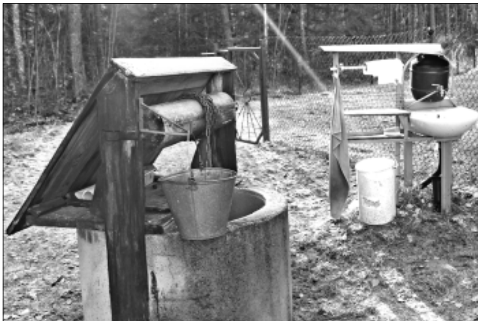
Aiz kapu žoga. Sakopta ir gan pati kapsēta, gan arī tās ārpusē. Akā vienmēr pietiek ūdens. Pēc kapu uzkopšanas darbiem cilvēkiem ir iespēja nomazgāt un noslaucīt rokas. Netālu ir arī neliels galdiņš ar soli, kur pasēdēt tuvinieku pulciņam.