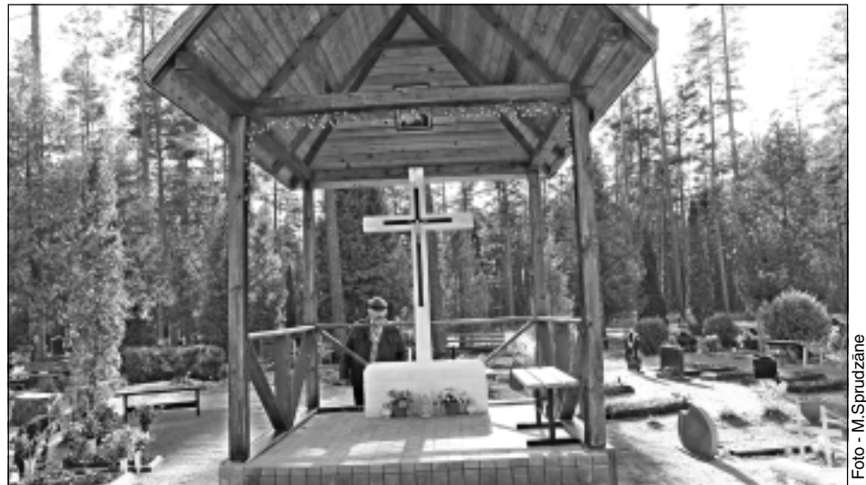
Atjaunots un saposts. Šogad Silaciema Kurnas kapos atjaunota pakāje pie galvenā kapu krucifiksa. Kapos nozāģēti arī trīs vecie bērzi. Koki sazāģēti un aizvesti.