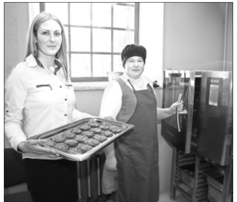
Ne vien jaunas iekārtas, bet arī jaunas receptes. Kafējnīcas virtuve vecajās dzirnavās aprīkota ar ļoti jaudīgām un ēdināšanas uzņēmumiem piemērotām iekārtām. Vienā no krāsnīm (fotogrāfijā) vienlaikus var cept gan kūkas, gan kotletes, gan arī plātsmaizes. Uzņēmējiem un viesiem pirmajā tikšanās reizē bija iespēja nobaudīt īpašo piedāvājumu - gardas putas un pupu burgeru, kas jau pavisam drīz būs pieejams jaunajā kafējnīcā. Kā zināja stāstīt saimniece, pupu burgeru sastāvs ir pavisam vienkāršs - tajā ir vārītas samaltas pupas un zirņi, dārzeņi, olas un garšvielas. Un šo gardo brīnumu var baudīt gan ar maizi, gan vienu pašu - kā kurš vēlas. Bet pats galvenais ir tas, ka šie produkti nākuši no tuvējiem “Kotiņu” laukiem - tātad pašu ražots un gatavots produkts.