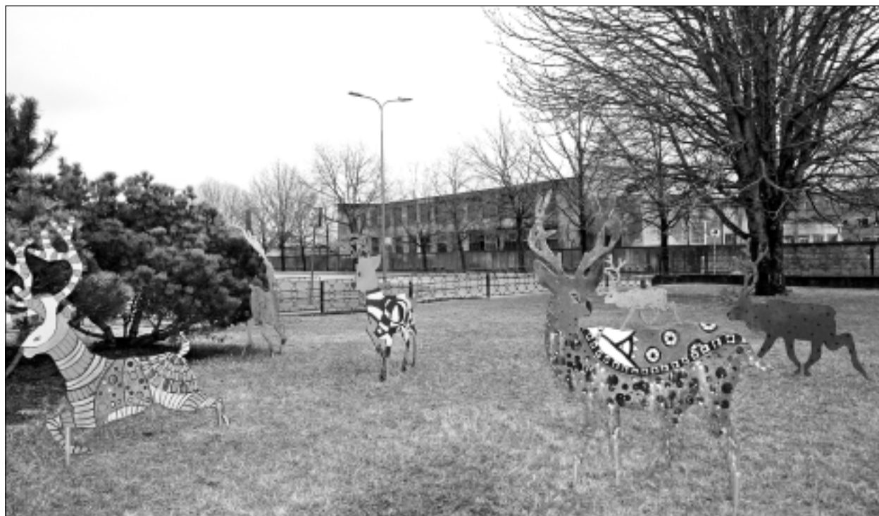
Visas dzīvas radībiņas. Pagaidām košās meža dzīvnieku figūras rotā Balvu Profesionālās un vispārīgizglītojošās vidusskolas pagalmu.