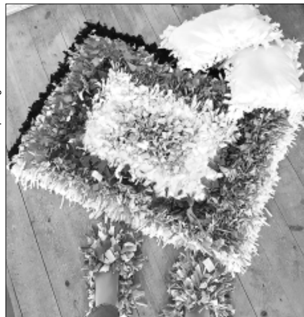
Glītāis rezultāts. Tagad lupatu paklājs, neparastās lupatu čības un abi spilventiņi aizceļojuši uz Rīgu, kur tos vērtēs stingrā konkursa žūrija.