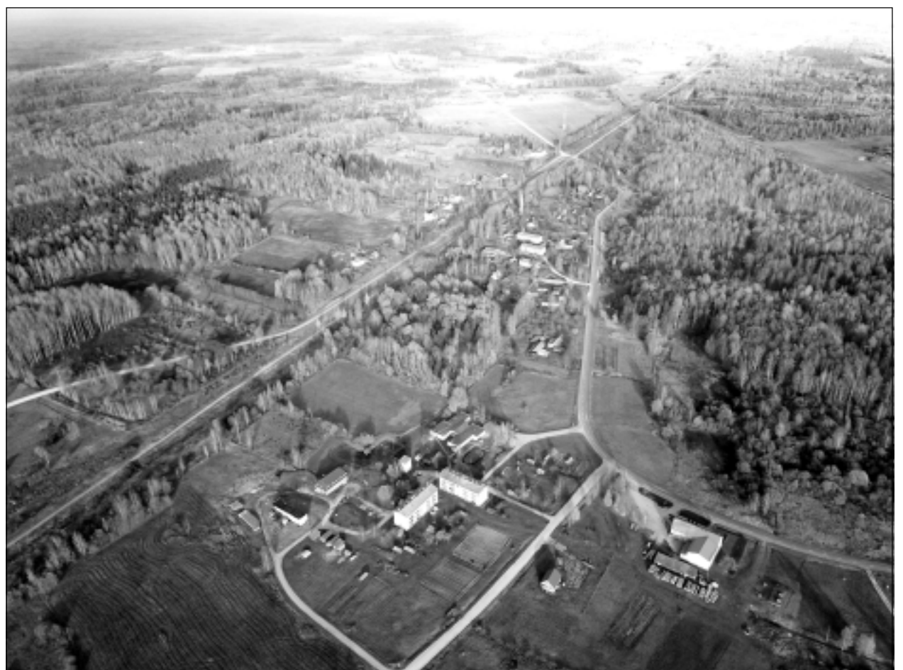
Vīksnas pagasts pirms 'Latvijai-100'.

Katra mēneša labākās fotogrāfijas autors saņems balvu. Fotogrāfijas var iesūtīt pa pastu – Balvi, Teātra ielā 8, LV-4501, vai elektroniski – vaduguns@apollo.lv . Pie foto obligāti norādāms vārds, uzvārds (vēlams - tālrunis).