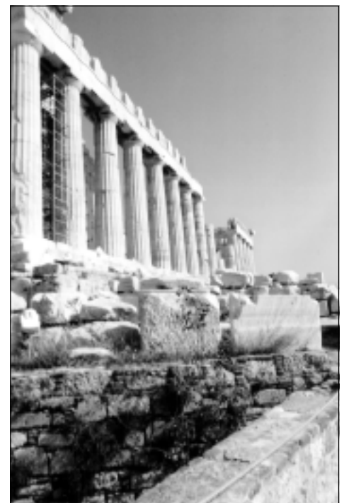
Atēnu Akropole. Viens no slavenākajiem apskates objektiem valstī. Šī vēsturiskā vieta atzīta par vienu no nozīmīgākajiem kultūras pieminekļiem Eiropā.