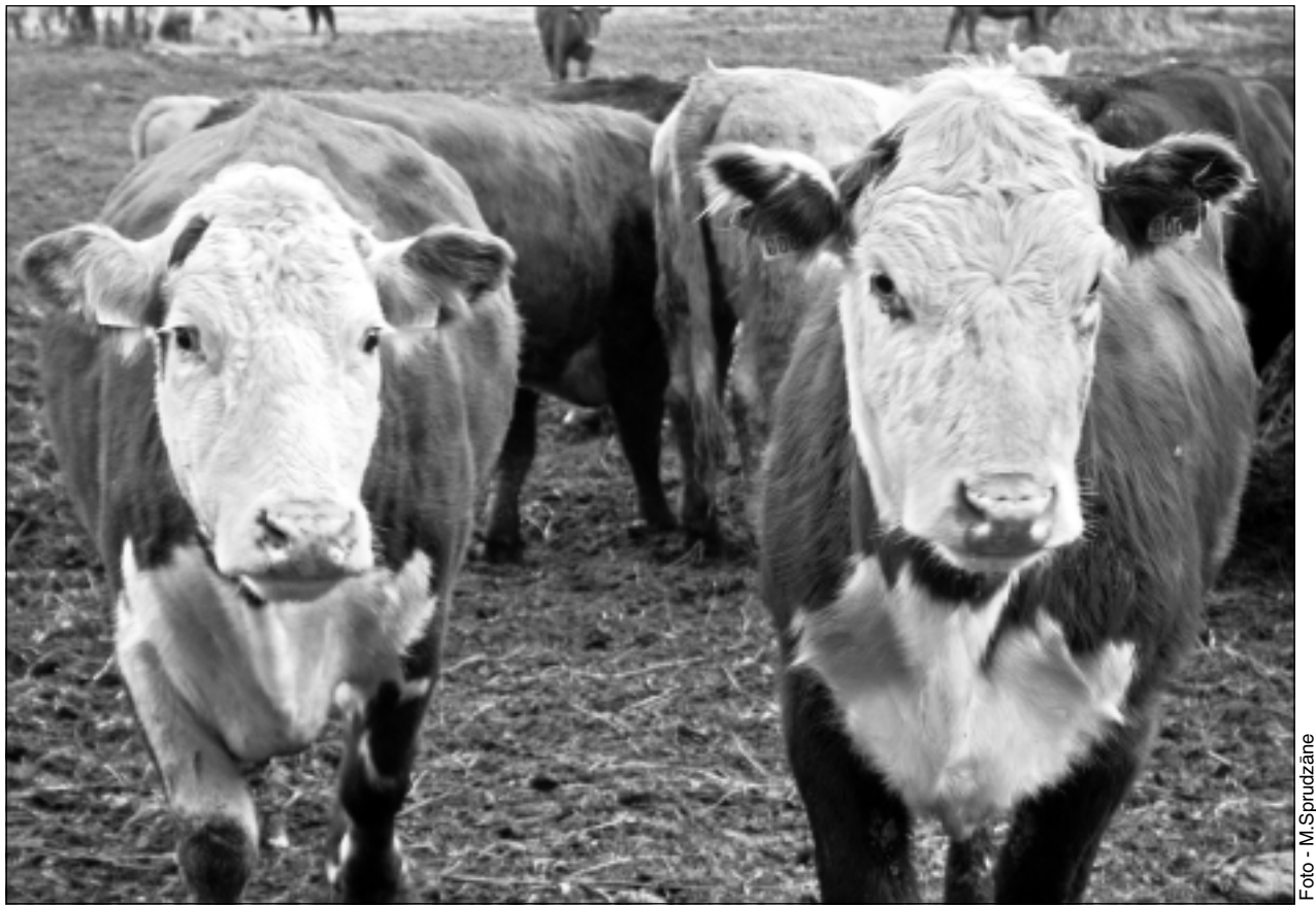
Gaļas liellopi. Gaļas liellopu audzētāju saimniecībām jau tagad jāsāk plānot un izvērtēt situāciju, kāda varētu rasties pēc 2020.gada, apsverot varbūtību, ka atbalsta maksājumi ievērojami samazināsies.

-Tie ir Šarolē un Limuzīnas šķirņu dzīvnieki, kā arī krusojumi. Ir saimniecības, kur audzē Herefordas šķirnes dzīvnie-