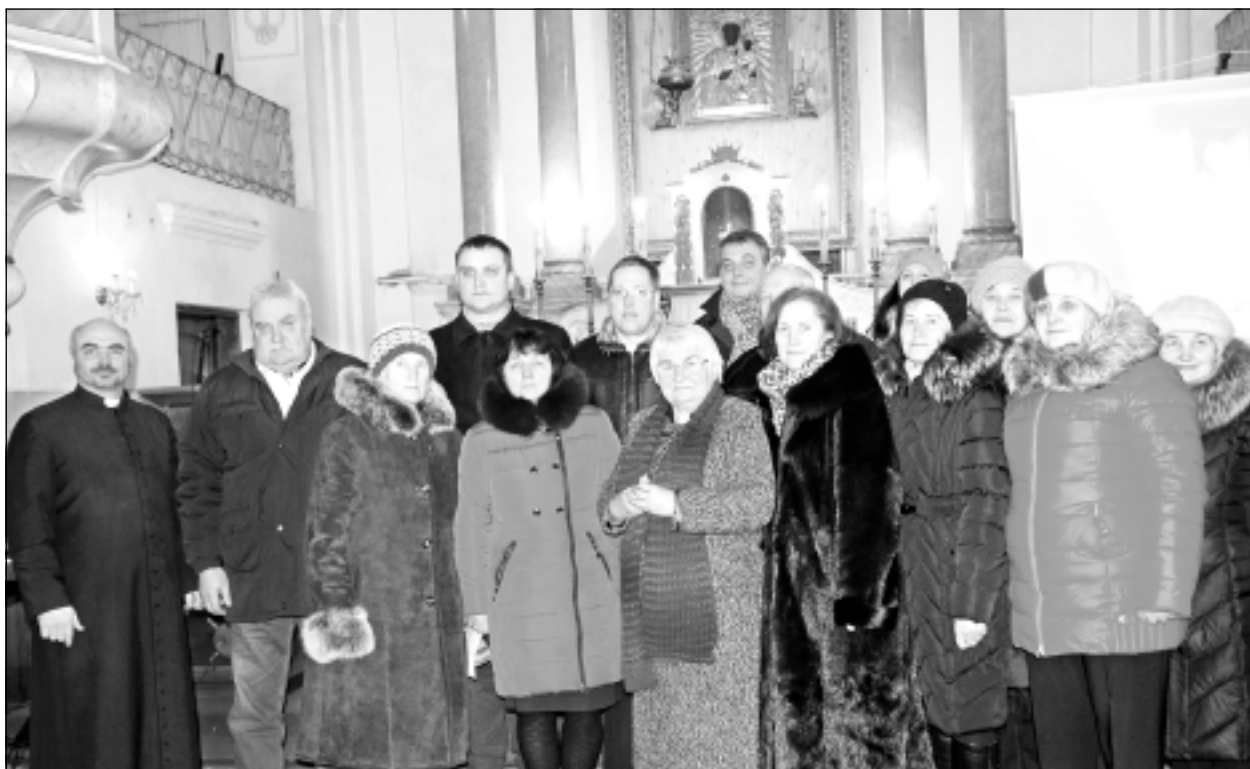
Martuževu dzimta saistīta ar Bērzpili. Pēc pasākuma kopā sanāca dzejnieces un viņas ģimenes tuvākie radi un draugi, lai atcerētos kopā pavadītos gadus un viņas mūža veikumu.

Te melodiskāk tēvu mēle skan, Te skaidrāka par ūdeņiem aust diena. Te dvē's le trīcēt mācījusies man Kā vēja kokle - no ik pieskāriena.