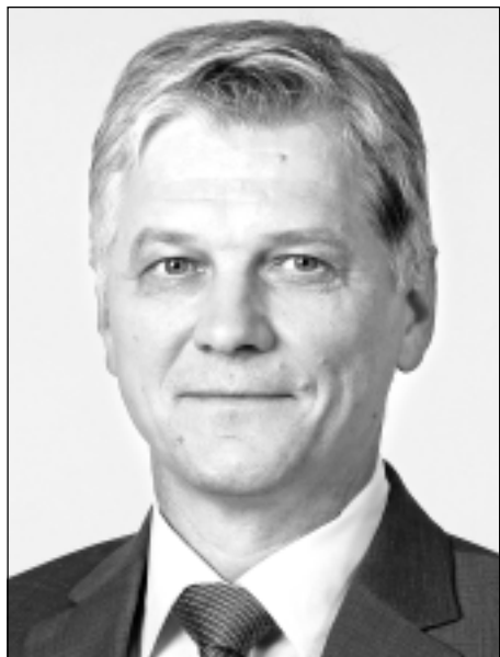
JĀNIS TRUPOVNIKS, Saeimas deputāts (ZZS)

Gads iesācies ar spraigām diskusijām par Stambulas konvenciju, tomēr arvien biežāk man gribas vaicāt, vai šī dokumenta ratificēšana patiešām ir pati būtiskākā problēma, kas mums nekavējoties būtu jārisina?