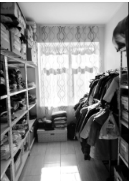
Mantu noliktava. Saziedotās mantas "Rasas pērles" glabājas noliktavā.

Paldies par ziedojumiem mēs parasti sakām tiem, kas nav mūsu darbinieki un viņu ģimeņu locekļi. Ziemassvētkos mēs cenšamies visus atcerēties, nosūtot bērnu darinātus apsveikumus. Arī paši darbinieki atved mantas, dārza labumus. Viņiem teiktā "paldies" paliek centra iekšienē. Tāpēc šoreiz - paldies visiem, kas atbalsta un uzlabo mūsu ikdienā.