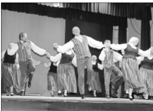
“Luste” atkal lustējas. Šoreiz mūspusē pazīstamie dejotāji izdejoja deju “Sānu dancis”.