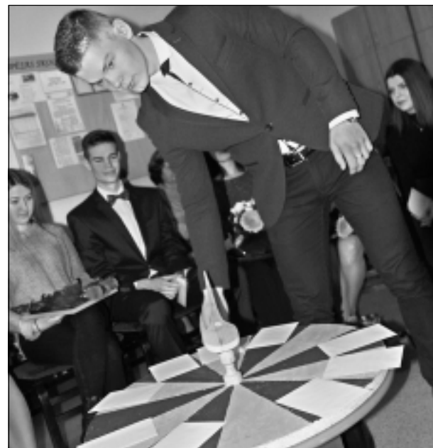
Kuru aploksnīti atvērt? Ar laimes rata palīdzību nominanti izvēlējās aploksnīti, kurās bija dažādi jautājumi par skolotājiem, sadzīvi, mācībām un aktuālo skolas laikā. Atbildes ļāva atsaukt atmiņā ģimnāzijā pavadīto laiku.