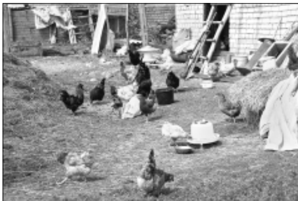
Spārnoto ganāmpulks. Nožogojumā pie kūts ganās prāvs pulks vistu un pāris gaiļi, kas, ieraugot saimnieci, steidzas viņai pretī, - būs taču atnesusi barību! Bet tiklīdz saimniece atstāj nožogoto teritoriju, spārnoto ganāmpulks steidz paslēpties kūtī. Vistas lieliski jūt, kurš ir savējais, kurš svešinieks.