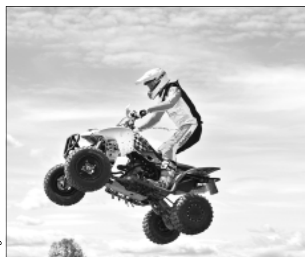
Vairāk skatītāju - tramplina vietās. Skatītāji, kuru šogad bija krietni mazāk nekā citus gadus, vairāk pulcējās tajās trases vietās, kur motosportisti lidoja gaisā. Garākais tramplins ir 28 metri, bet lēcieni šajā trasē var pārsniegt pat 60 metrus.