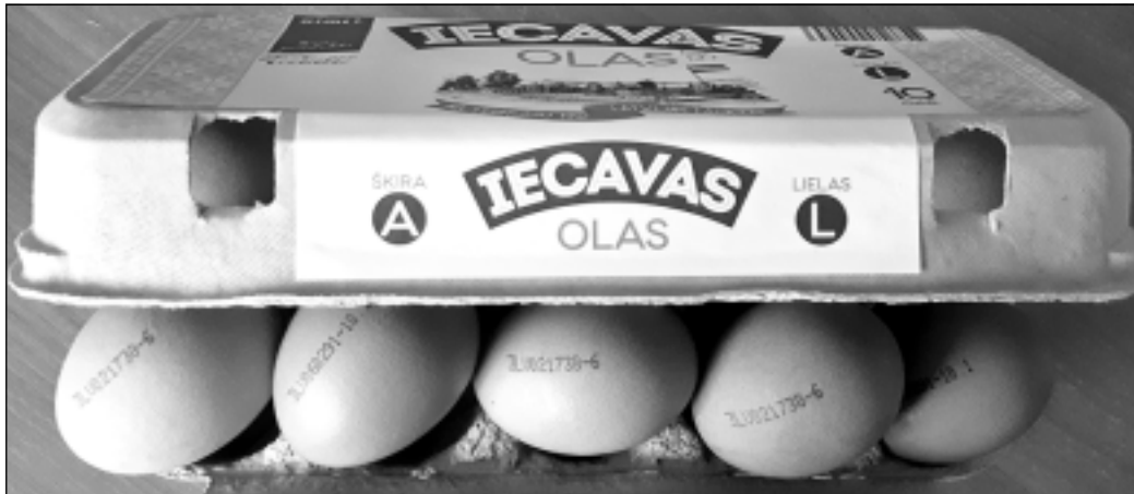
Pilnvērtīgs olbaltumvielu avots. "Olas uzturā lietojam vairākas reizes nedēļā, bet olas ar dažādu marķējumu vienā iepakojumā uz tām pamanījām pirmo reizi. Kāpēc tās ir ievietotas vienā kastītē?" interesējas balvenieši.

Iepakojumā var būt arī dažādu svara šķiru olas, bet tad uz iepakojuma būs uzraksts "dažāda izmēra olas".