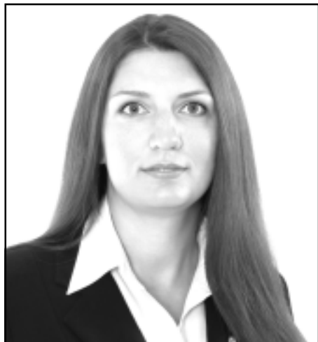
INGA VANAGA , Latvijas Izglītības un zinātnes darbinieku arodbiedrības priekšsēdētāja

Latvijas Izglītības un zinātnes darbinieku arodbiedrības (LIZDA) priekšlikums ir nacionālā līmenī noteikt Covid-19 izplatības līmeni uz noteiktu iedzīvotāju skaitu pašvaldībā. Tas nodrošinātu šo individuālo pieeju pašvaldībām un nebūtu visām jāorganizē mācību process kā ārkārtas situācijā, bet tiktu ņemta vērā Covid-19 izplatība attiecīgajā pašvaldībā. Būtiski būtu ļaut izglītības iestādēm un pašvaldībām lemt pašām par to, kā tiek organizētas daļēji attālinātas vai attālinātas mācības, ņemot vērā pieejamos resursus, kā arī no nacionālā līmenī sniegt nepieciešamo palīdzību, ja