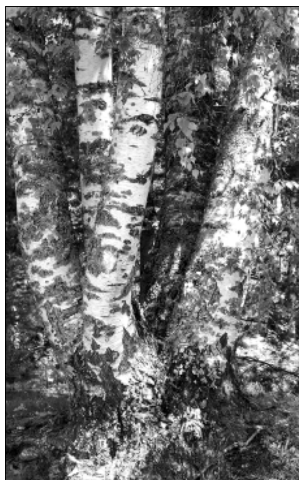
Bērzs ar pieciem stumbriem. Pie pagrieziņa uz vienu no gleznainākajām vietām Susāju pagastā - Mitrakalnu - ceļa otrā pusē aug interesants bērzs, kas, saaugot kopā, izveidojis piecus stumbrus. Atgādinām, ka Mitrakalns ir privātīpašums. Īpašnieks neliedz to apmeklēt, lai baudītu skaistos skatus, bet lūgums un prasība ir uzvesties pieklājīgi un nepostīt dabu.