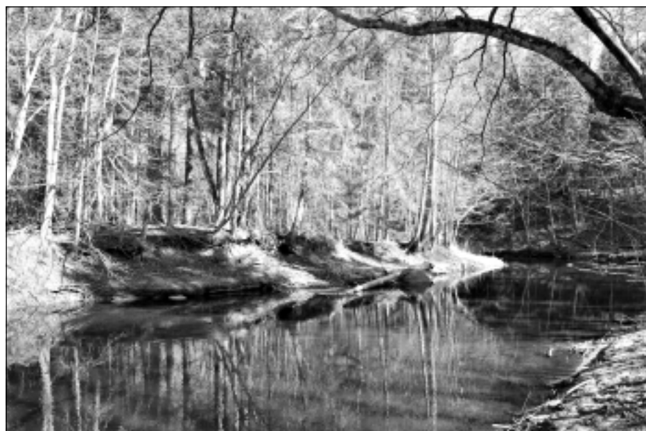
Gleznaina upe. Apsēkojot Liepņas upes ieleju, dabas mīļotājiem tā rada gleznainu iespaidu. Upe nav dziļa un droši izbrienama zābakos.

Pārgājiens sākas no tā sauktā vecā Golodņika ceļa gar Liepņas upi, dodoties lejup līdz pat iespaidīgajam Kaķišu akmenim, kopā ar atpakaļceļu mērojot 5 km. Maršrutā var redzēt daudz dažāda lieluma laukakmeņus, kuri veido krāces un strauļteces, skatāmi arī mālu atsegumi un pazemes